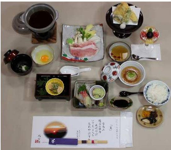
料理写真はイメージです。

お一人でも65歳以上の方がいらっしゃれば、ご家族・グループでご利用いただけます。