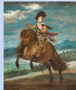
ディエゴ・ベラスケス 《王子チャールズ・カルロス騎馬像》 1635年頃 マリノ、プラド美術館蔵

期 間 6月13日(水)から10月14日(日) 展示内容 プラド美術館展-ベラスケスと絵画の栄光- 開館時間 10時から18時(金土は20時まで) ※入館は閉館の30分前まで 休 館 日 月曜日 (月曜日が祝休日の場合は翌日が休館日) 住 所 神戸市中央区脇浜海岸通 1-1-1 TEL 078-262-0901 ※先着10名様まで