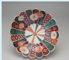
《色絵菊花唐花菱雲文菊花形鉢》1690~1710年代 佐賀県立九州陶磁文化館所蔵/柴田夫妻コレクション

期間 6月15日(土)から9月29日(日) 展示内容 恋する古伊万里 -かたちとデザインの魅力- 開館時間 10時から18時 ※入館は閉館の30分前まで (7~8月の土日は9時30分から19時) 休館日 月曜日(ただし7/15, 8/12, 9/16, 9/23は開館、 7/16, 8/13, 9/17, 9/24は休館) 住所 丹波篠山市今田町上立杭4 TEL 079-597-3961