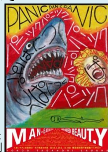
ポスターデザイン: 横尾忠則

期間 5月25日(土)から8月25日(日) 展示内容 人食いザメと金髪美女 -笑う横尾忠則展 開館時間 10時から18時(金土は20時まで) ※入場は閉館の30分前まで 休館日 月曜日(ただし7/15, 8/12 は開館、7/16, 8/13は休館) 住所 神戸市灘区原田通 3-8-30 TEL 078-855-5607